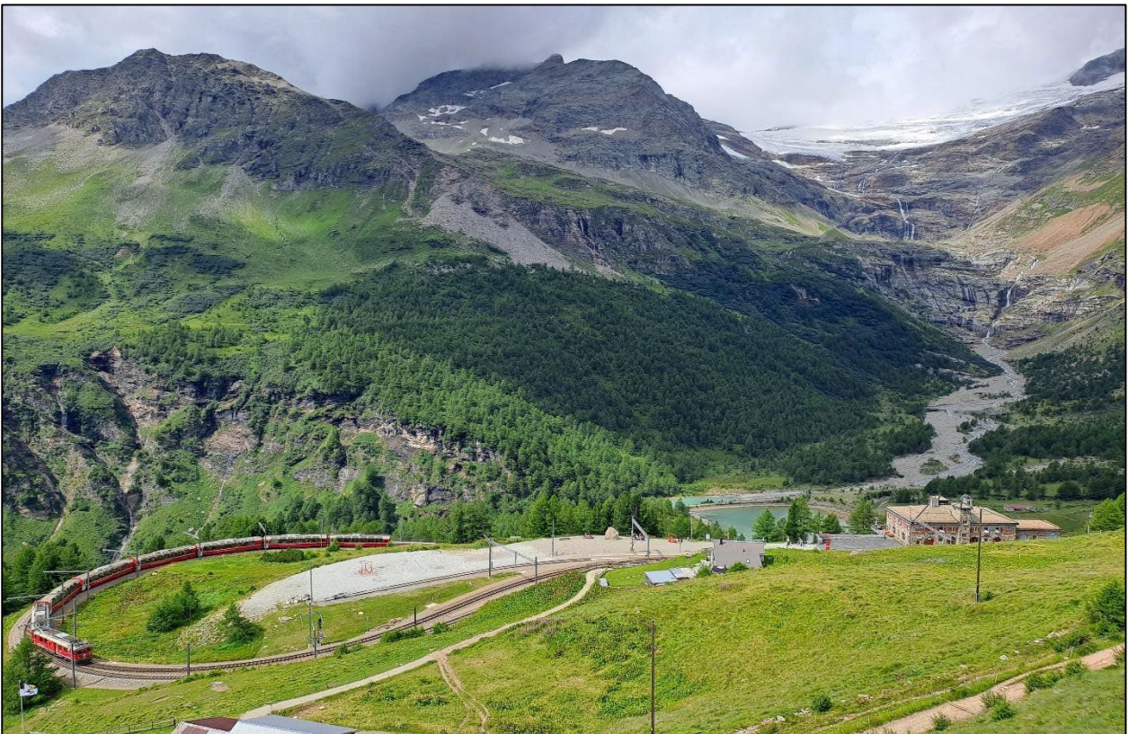
Die Alp Grüm ist unser Ausflugs-Ziel. Von hier aus bietet sich Ihnen auf 2091 m ü. Meer ein unbeschreibliches Panorama.