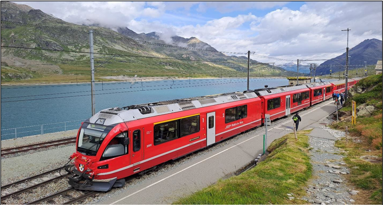
Ausstieg ist für die Wandergruppe bei der Station Ospizio Bernina.

Auf einer leichten Höhenwanderung von rund 60 Minuten gelangen Sie direkt zur Albergo Belvedere. Folgen Sie dem Wanderwegweiser 30 + 53 – Ganz einfach, auf dem Fahrweg bleiben.