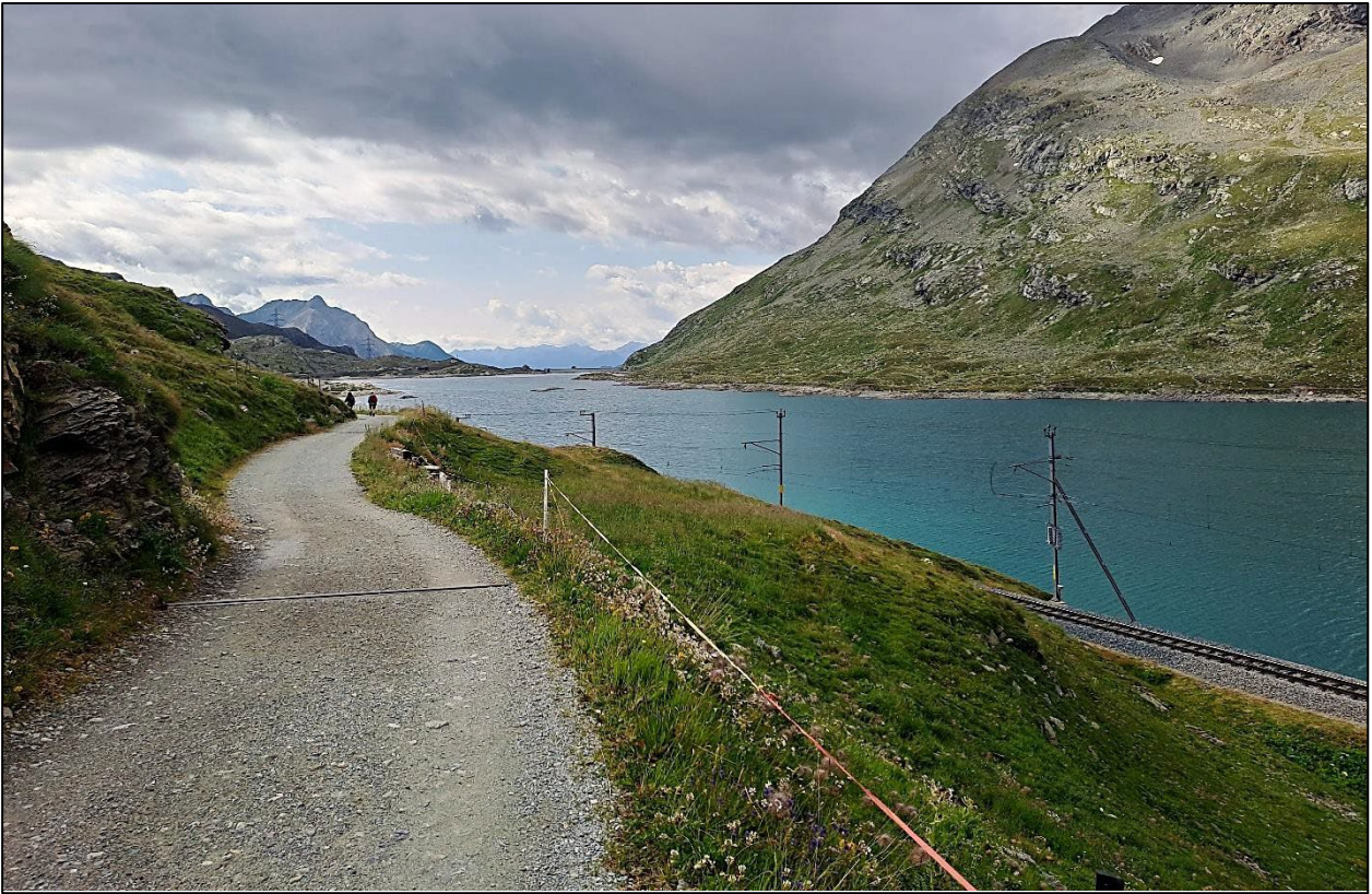
Der Lago Bianco, der Stausee auf 2234 m ü. Meer am Fusse des Berninapasses.